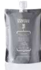
ACTIVATOR 40 VOL - 12% Pakovanje: 850 ml