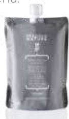
ACTIVATOR 10 VOL - 3% Pakovanje: 850 ml

Bogata i hranljiva specijalna oksidativna krema. Izuzetno kremasta tekstura doprinosi ugodnom servisu i dodaje udobnost na vlasištu. Kosa je meka i nahranjena posle usluge. Formula je obogaćena prirodnim sastojcima: rižinim mlekom hranljivih svojstava i šećerom za dodavanje sjaja. Dostupno u 4 različita volumena.