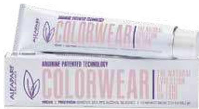
Tuba: 60 ml

Clear and Gloss - savršen sjaj dlake bez pigmentacije ili ublažavanje intenzivnih tonova, ovaj proizvod ima svestra- nu i laku upotrebu.