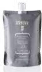
ACTIVATOR 20 VOL - 6% Pakovanje: 850 ml