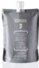
ACTIVATOR 30 VOL - 9% Pakovanje: 850 ml